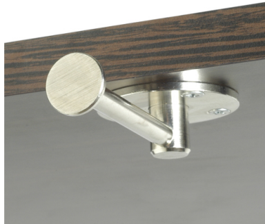
Fourni avec 4 vis à bois 3.5x16