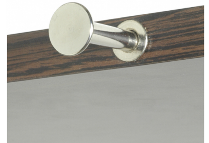
Fourni avec ou sans usinage Perçage Ø14mm